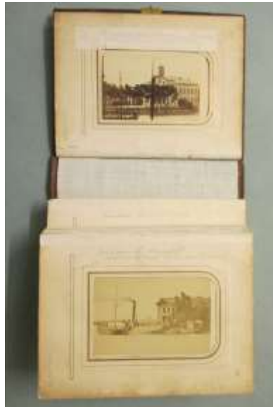
Een van de drie fotoalbums met foto's van Breebaard voorafgaand aan de conservering