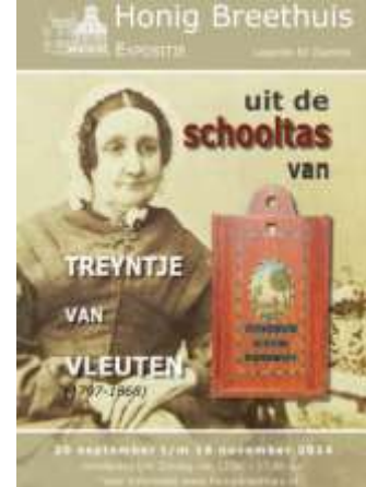
Tentoonstellingsaffiches ontworpen door Laura Verburg