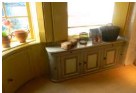
het Zaanse 'bontje' in de keuken van het Honig Breethuis

Rijksdienst voor het Cultureel Erfgoed. Bovendien konden wij voor de museale inrichting van het museum pand beschikken over een zgn. Zaanse rechtbon of 'bontje' uit de collectie van de Stichting Zaanse Schans. Dit meubelstuk stond sinds 1976 opgesteld in het herbouwde pand aan de Kalverringdijk 3 op de Zaanse Schans te Zaandam en is thans in gebruik genomen in de woonkeuken van het Honig Breethuis.