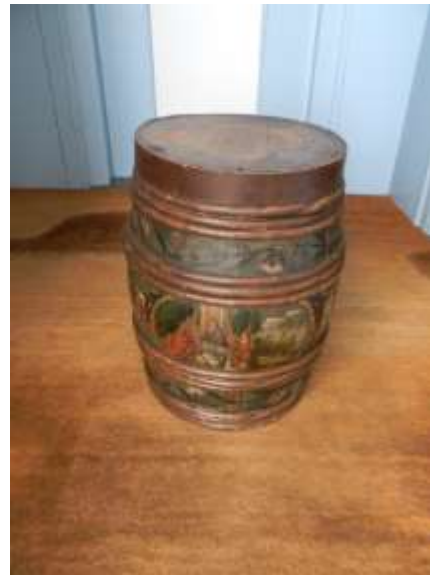
Een blik in de kabinet-expositie 'Uit de schooltas van Treyntje van Vleuten' met de beschilderde schooltas en de meelton. (najaar 2014)