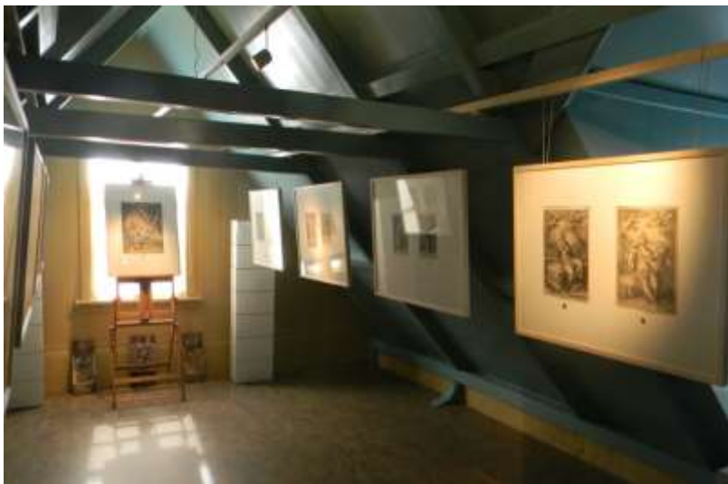
Een blik in de nieuwe presentatieruimte in het luchthuis die werd geopend met de De Saenredam-tentoonstelling