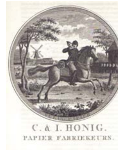
Riemetiket Velijnpapier C&I Honig