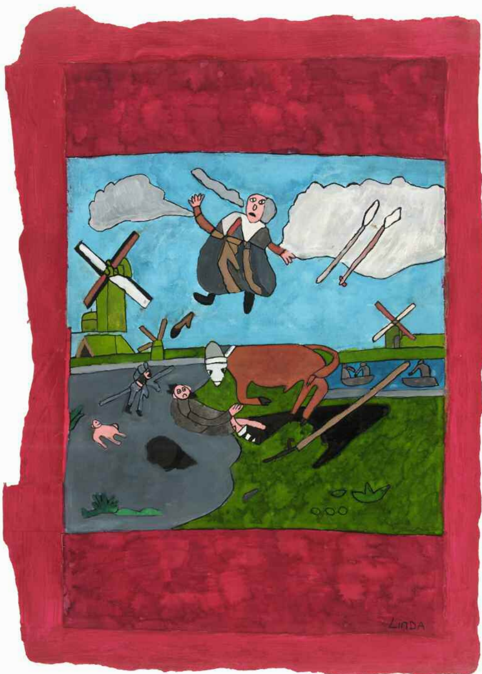
Linda Meijer: Vliegende Hollander (Gemengde techniek op papier, 53 x 37 cm)