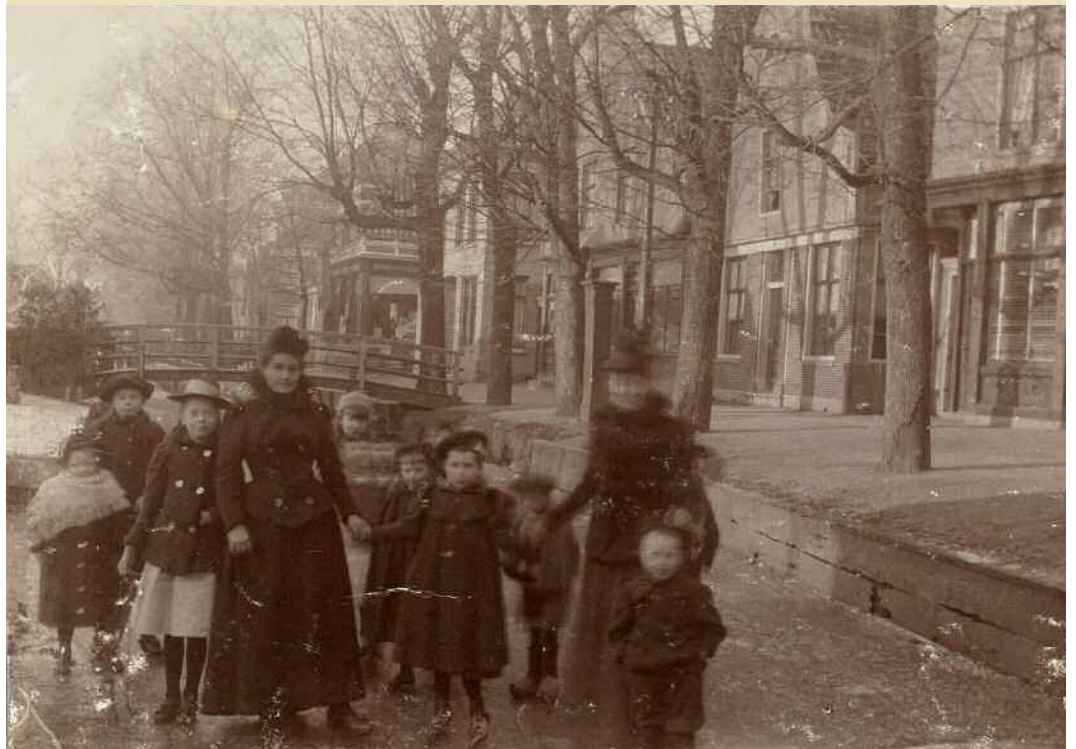
Poserende passanten op de bevroren wegsloot aan de Lagedijk te Zaandijk nabij het Gorterspad, ca. 1900.

Het bestuur wenst alle leden en huisvrienden fijne feestdagen en veel voorspoed in het nieuwe kalenderjaar!