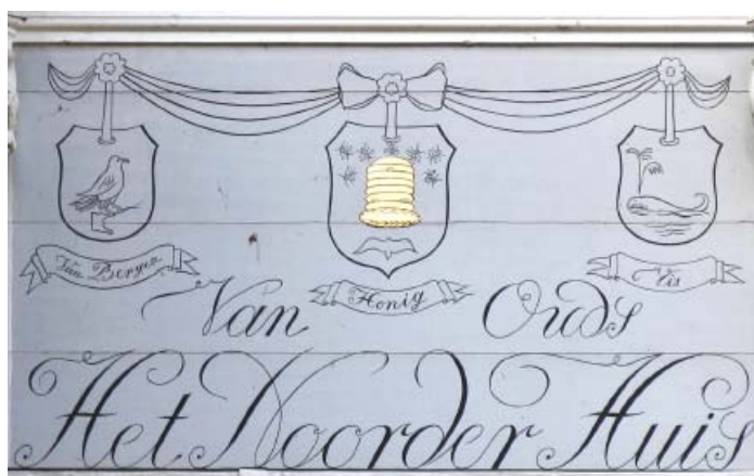
Gevelbord Noorderhuis met familie-wapens Van Bergen, Honig en Vis.