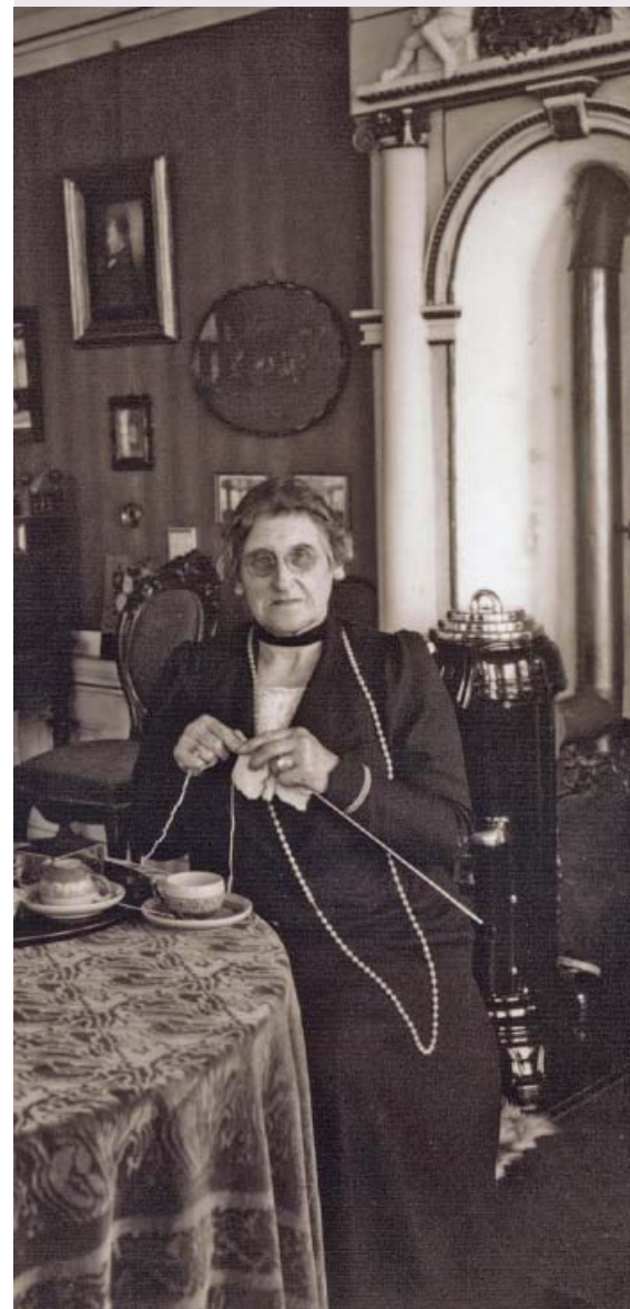
Neeltje de Jager bewoonde het huis van 1811 tot 1840.