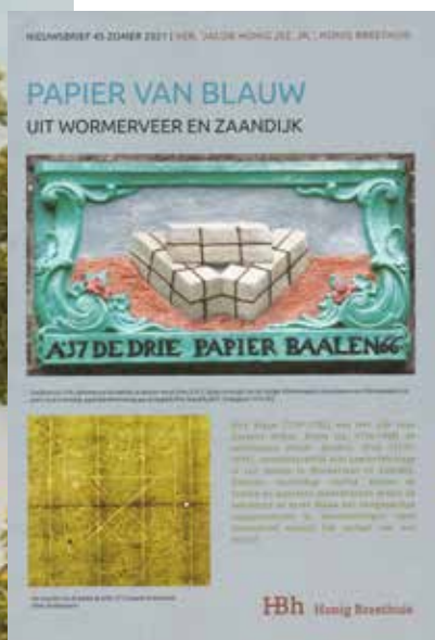
Nieuwsbrief 41 zomer 2021, gewijd aan de papierfirma's Blauw in Wormerveer en Zaandijk.