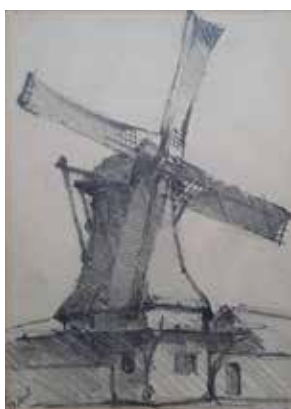
Tekening van papiermolen De Koperslager door Frans Mars.