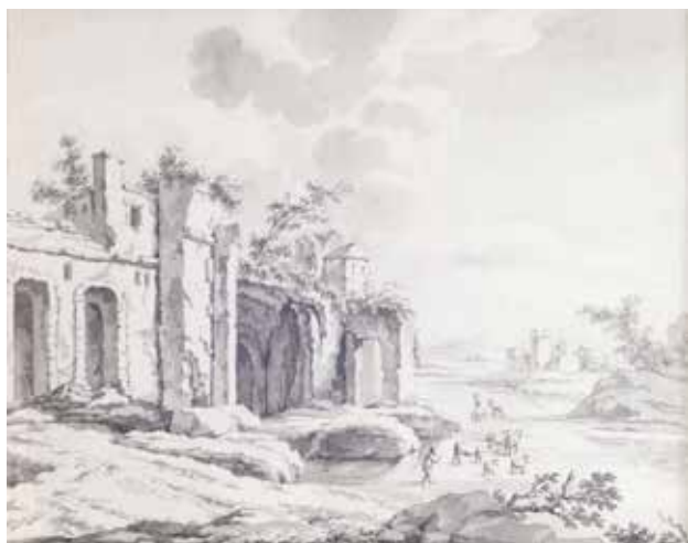
Landschap met ruïne en herder met vee. Sepia, 20 x 24 cm.