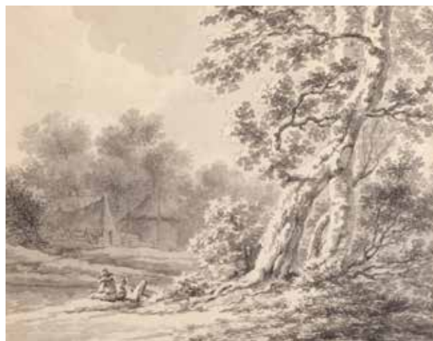
Landschap met hoeve en rustende figuren langs een weg. Sepia, 20 x 24 cm.