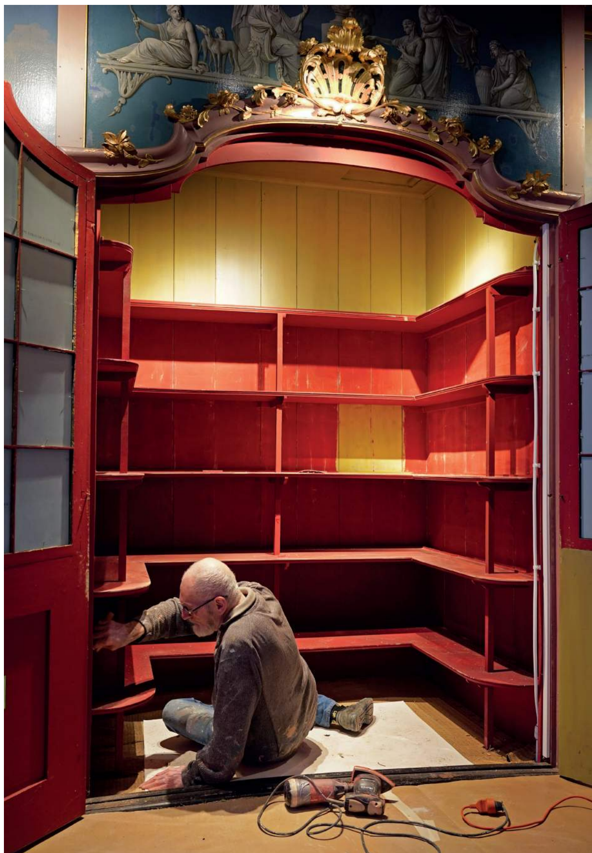
Werk aan de transitie van bedstee naar tentoonstellingskabinet.