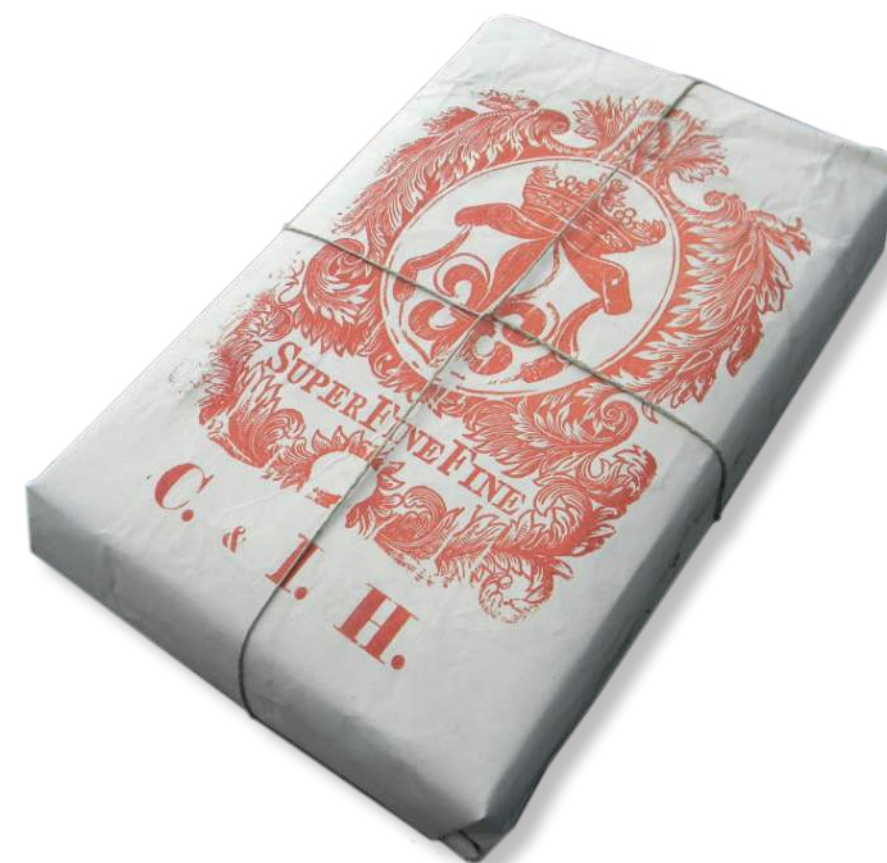
Een riem papier met riemkap van C. & I. Honig. Een riem bestond uit ca. 500 vellen papier die waren verpakt in een riemkap, een omslag gevouwen van twee vellen papier die met touw bijeen waren gebonden. Op de riemkap stonden vaak het handelsmerk, de initialen van de papiermaker en een aanduiding van de kwaliteit van het papier.